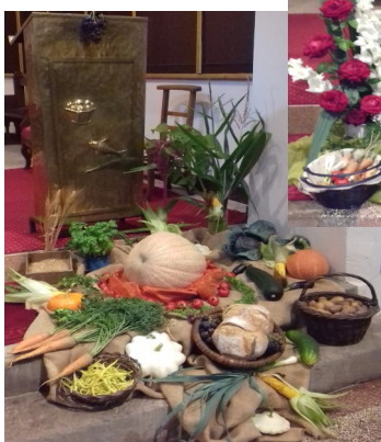
Bénédictio des récoltes Schwenheim