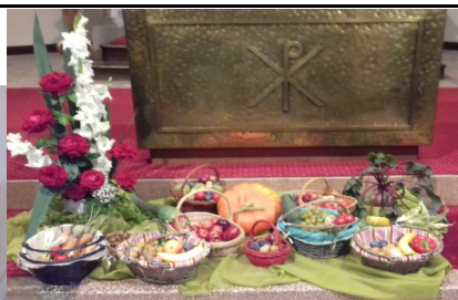
Bénédictio des récoltes Sindelsberg